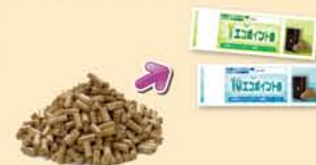
木質ペレットを購入するとエコポイントが!