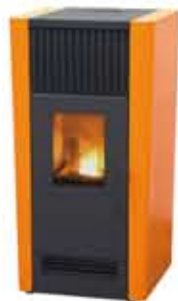
ペレットストーブ「ほのか」 (エクセレントデザイン賞受賞)

ペレットストーブは、国内外の様々な製品があります。ペレットストーブでは、ペレットを1日約7時間でおおよそ10kg使用します。価格は、30～50万円程度（別途工事費）かかり、少し高価かもしれませんが、平成27年度は、ペレットストーブ設置費用に関して山形県から1/3の補助金と、市町村によってはその県の補助金に上乗せして1/3～1/2の補助金が出ています。また通常の維持管理を行えば10年以上使用することができます。